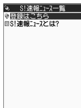
S!速報ニュース一覧画面